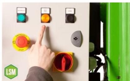
Sikker oversikt over tilstand. Fullmelder ved full.