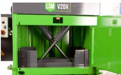
Krysspress. Kraftig presse med rask syklusid