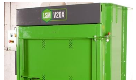
Kun 2 meter høy og 1 meter bredde