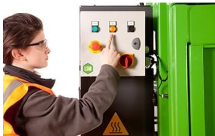
Lavspenning på brukerpanel for økt sikkerhet