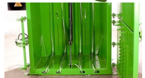
Integrert utkaster for utkast av ferdig presset balle