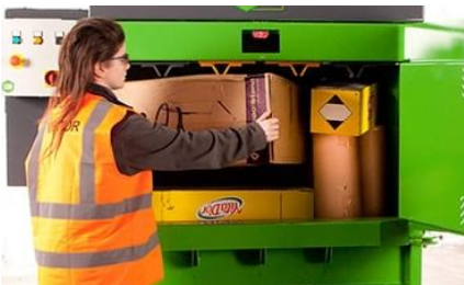
Kraftig komprimeringsevne og stort fyllkammer