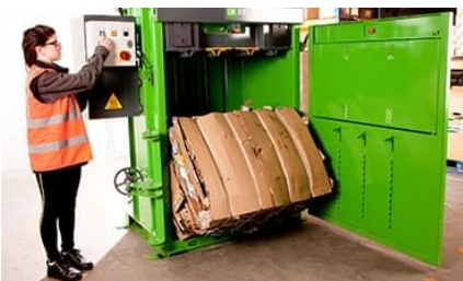
Lager baller opptil 250 kg .