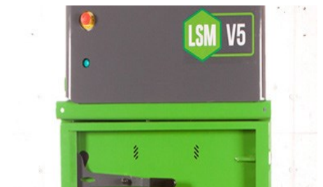
Endast 28 sekunders cykel