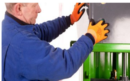
Låg spänning på användarpanelen för ökad säkerhet