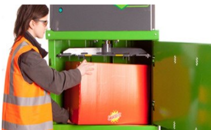
Stark komprimeringsförmåga och stor påfyllningskammare