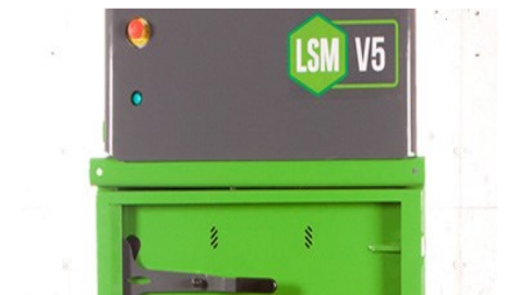
Bare 28 sekunders syklus