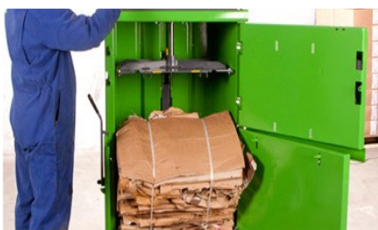
Integrert utkaster av ballen