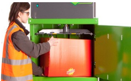
Kraftig komprimeringsevne og stort fyllkammer